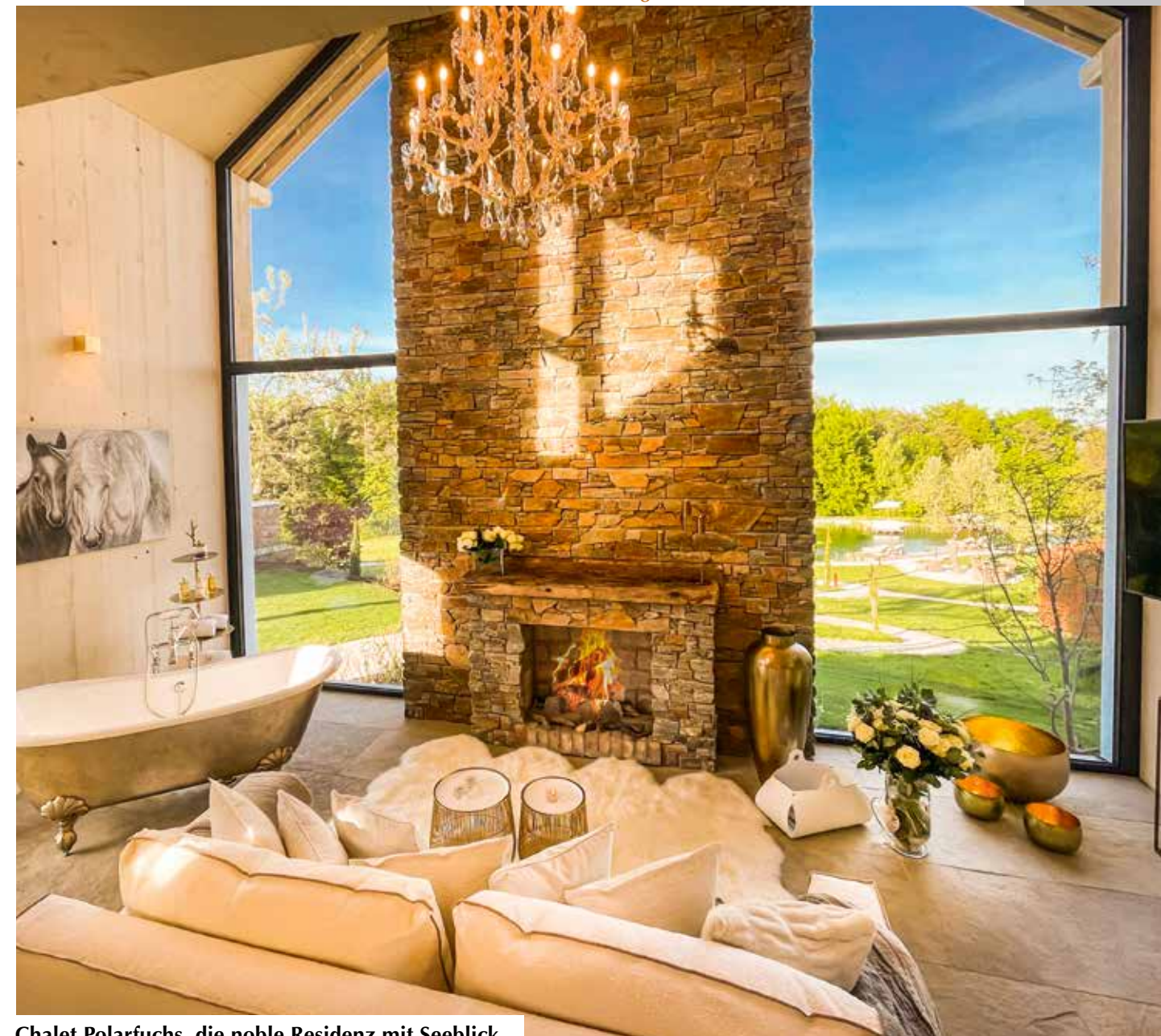
Chalet Polarfuchs, die noble Residenz mit Seeblick.