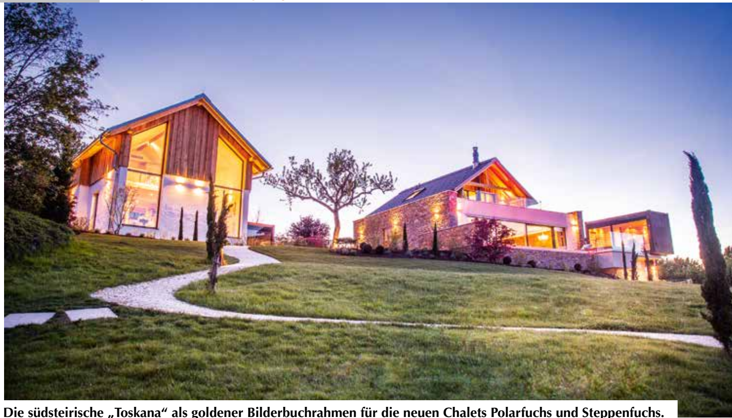
Die südsteirische „Toskana“ als goldener Bilderbuchrahmen für die neuen Chalets Polarfuchs und Steppenfuchs.