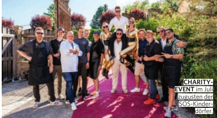
CHARITY-EVENT im Juli zugunsten der SOS-Kinderdörfer.